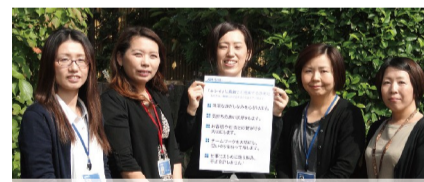
JSプロジェクトメンバー

さらなるお客様満足の向上のため、みなさんが力を発揮できるサポートを今後も精力的に続けていきます。