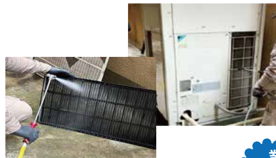
フィルター清掃作業